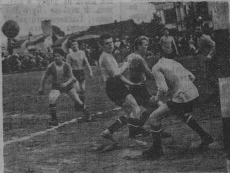
На снимке: острый момент у ворот команды лесоучастка Вая.