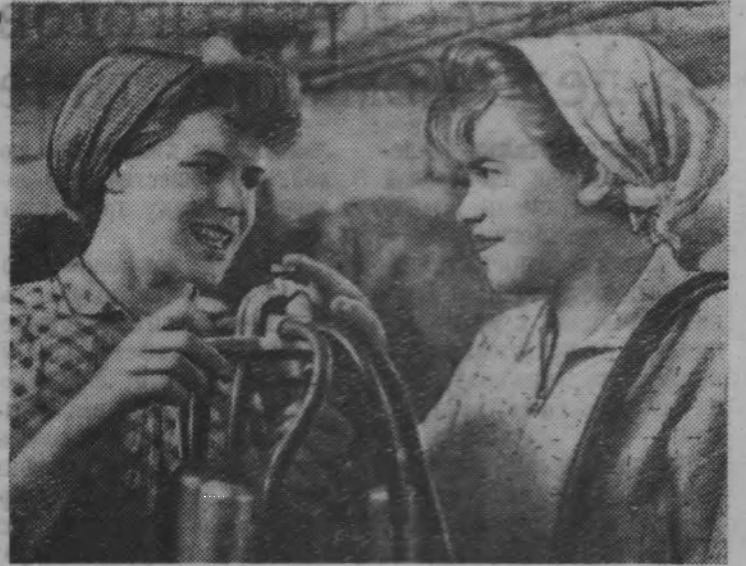
Костромская область. В колхозах и совхозах области работает много комсомольцев и молодежи, которые пошли трудиться на поля и фермы по зову партии.

Все, что происходило в этот вечер во Дворце, явилось незабываемой, волнующей демонстрацией любви и заботы нашей Родины, народа, партии о миллионах юных ленинцев, о тех, кто в пионерских отрядах и дружинах готовится к великой битве за дело Ленина, за коммунизм.