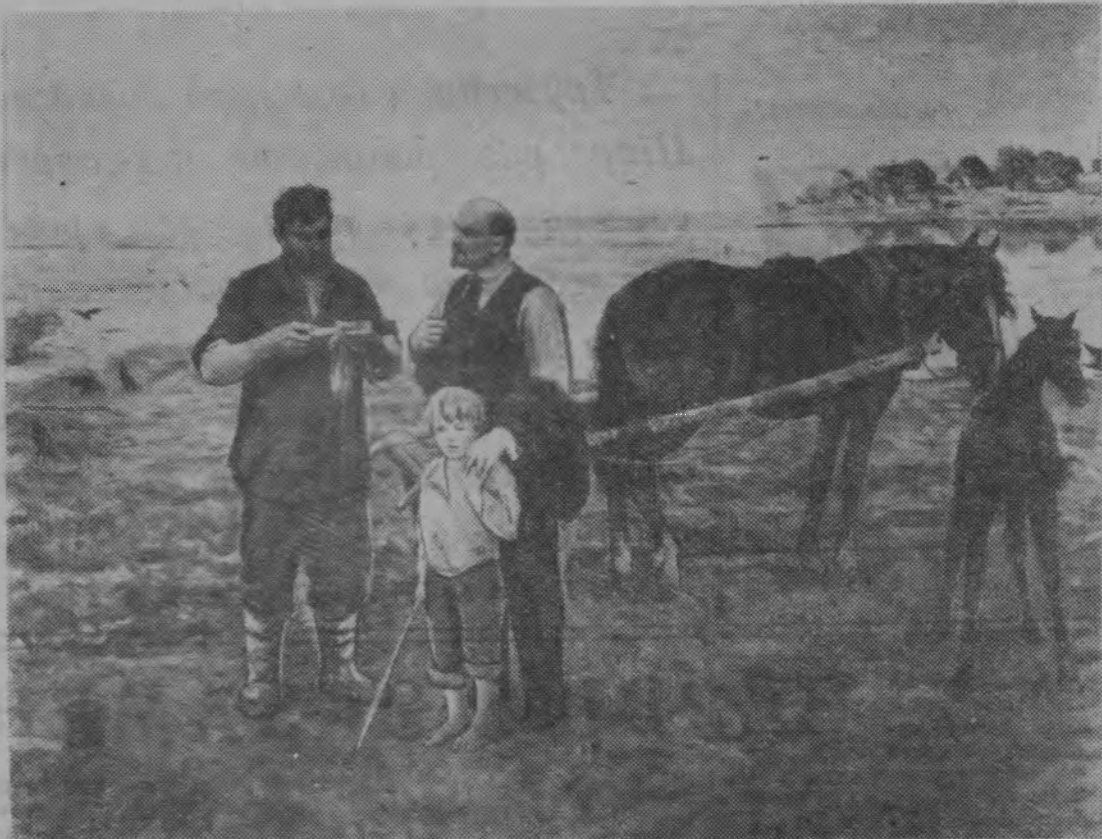
Владимир Ильич Ленин на пашке.