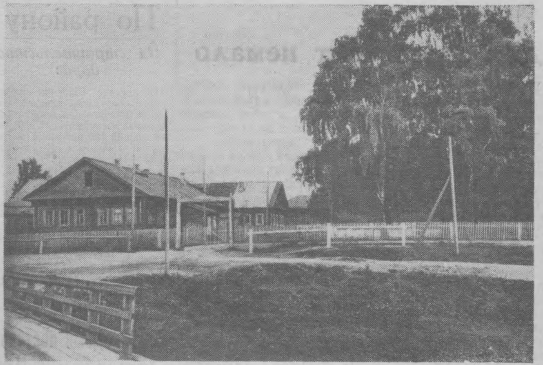
Село Тоншаево. Районная больница.

У берегов Мозамбика была поймана странная рыба, голова которой напоминает человеческую. Для ученых-ихтиологов эта рыба со «скорбной складкой» у рта остается загадкой, так как ее нельзя отнести ни к одному из известных видов.