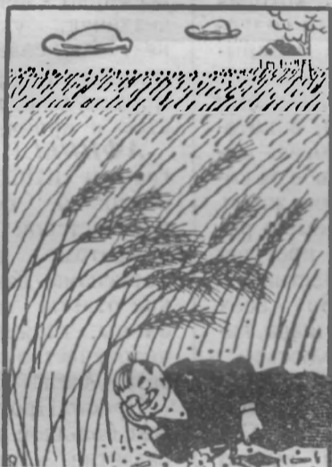
—Если б колос имел голос! Рис. М. Вайсборда.