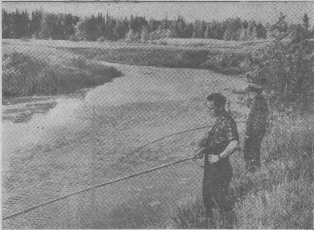
На реке Пижме