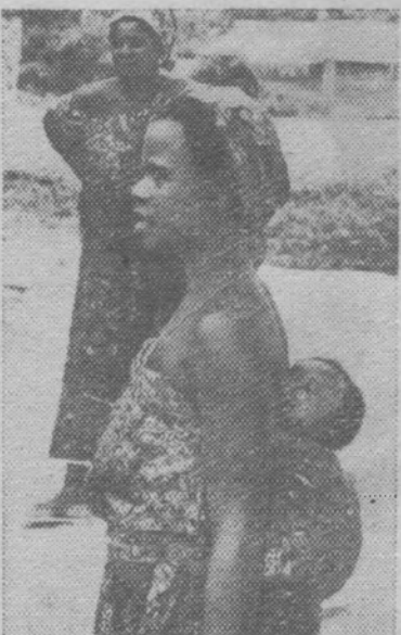
Республика Гана. Так во многих странах Африки матери носят своих детей.

Выставка показала, что имеются все возможности для дальнейшего расширения сотрудничества между СССР и Великобританией в области экономики и культуры. (ТАСС).