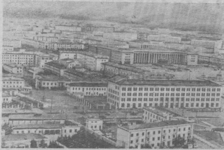
Столица Народной Республики Монголии Улан-Батор (Вид с вертолета).