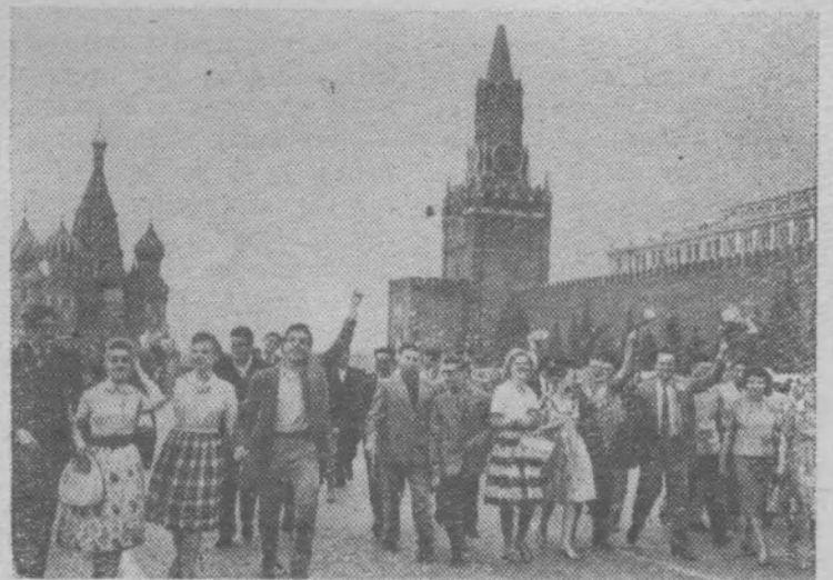
Группа молодежи из стран Латинской Америки с москвичами на Красной площади.