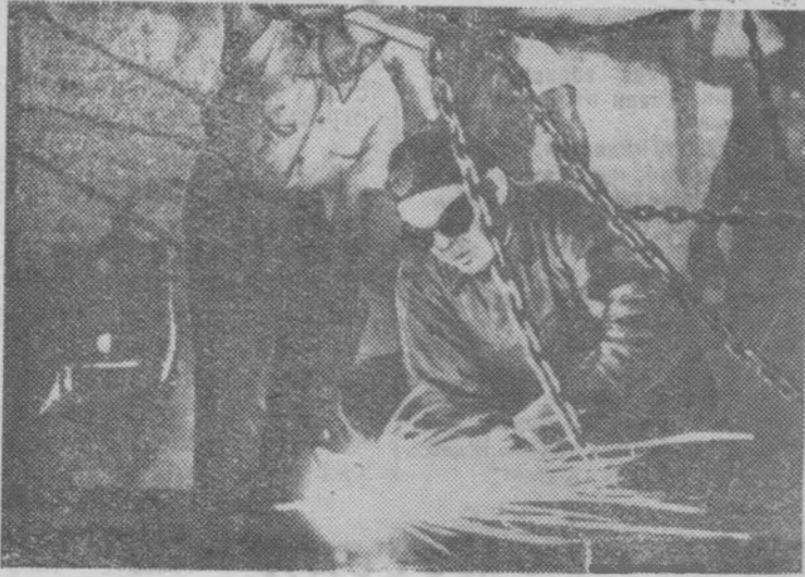
Республика Куба. В районе Эскамбрай начато строительство гидроэлектростанции.

На снимке: на участке строительства.