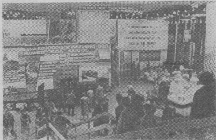
На снимке: в разделе «Сельское хозяйство».

Типография газеты «Тоншаевский колхозник» с. Тоншаево, Горьковской области