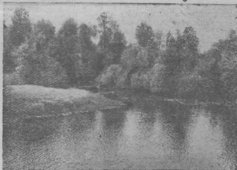
Река Пижма. Легкий ветерок.