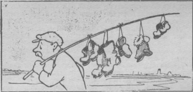
—В дальний путь.