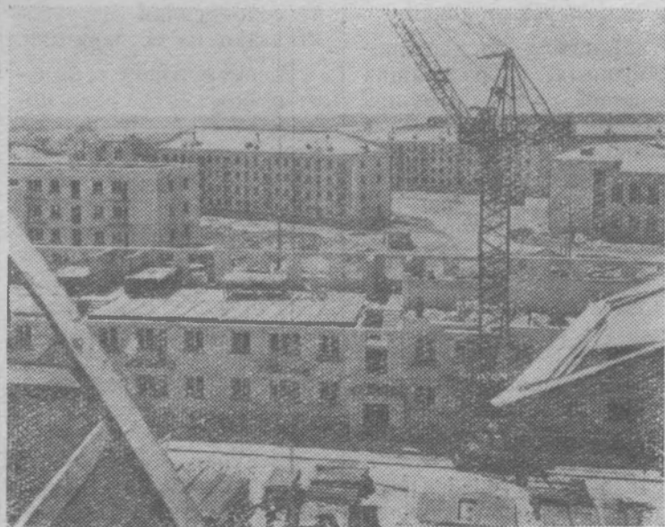
Саратовская область. Коллектив ударней комсомольской стройки—Ба-

лаковского комбината искусственного волокна готовит трудовые подарки