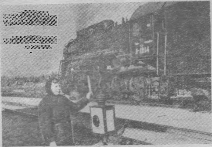
Железнодорожная станция Пижма. День и ночь через нее идут товарные и пассажирские поезда.

Каждый день со станции уходят составы, груженные лесом. Лес, заготовленный рабочими Пижмского леспромхоза, идет на экспорт в страны.