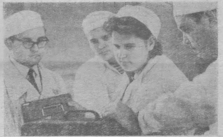
Редактор П. БАКУЕВ.

Тоншаевскому комбинату бытового обслуживания требуются на постоянную работу: квалифицированный закройщик по дамскому легкому платью, мастер по ремонту радиоприемников и телевизоров, мастер по ремонту швейных машин, велосипедов, патефонов, мастер по строчечивальным изделиям.