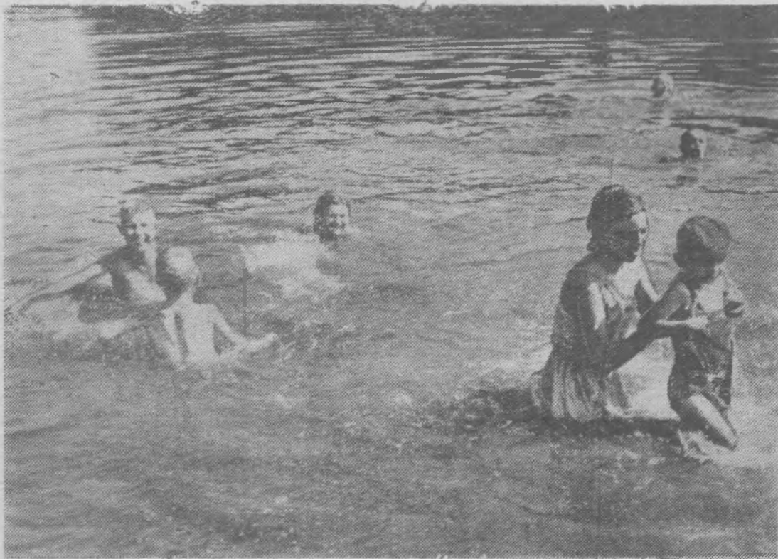
На реке Пижме