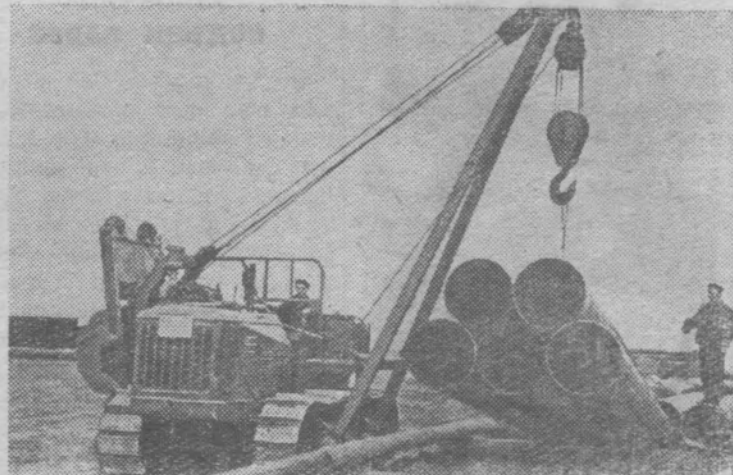
Белорусская ССР. Через Брестскую область пройдет трасса гигантского нефтепровода «Дружба», который сооружают советские, чехословацкие и венгерские люди.

Строителям участка № 2 треста «Мосгазопроводстрой» предстоит проложить 450 километров трассы. В текущем году они обязуются уложить 150 километров труб. Это их подарок к предстоящему XXII съезду КПСС.