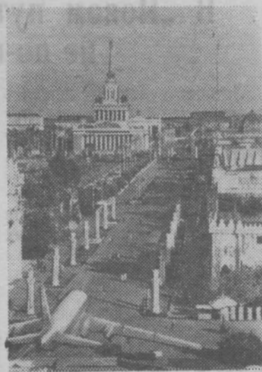
Москва. Выставка достижений народного хозяйства СССР.

Участники просмотра, представители советской общественности встретили фильм с большим одобрением.