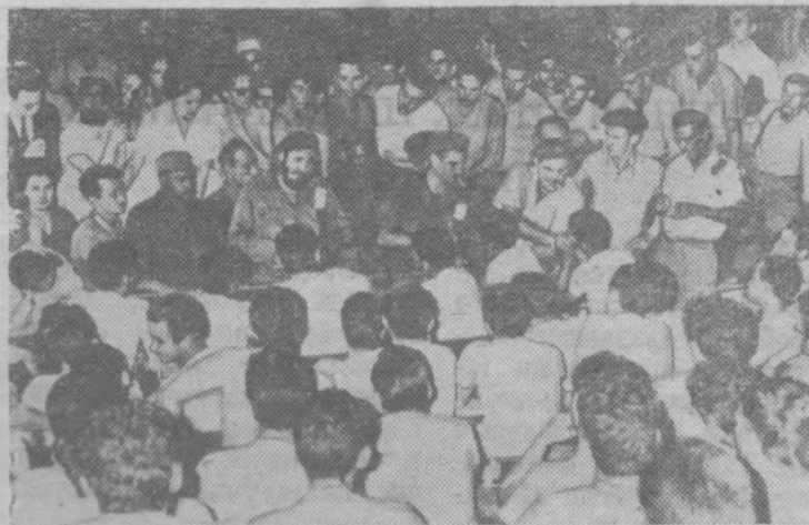
Кубинская Республика. Гавана. Наемники, взятые в плен, были собраны во Дворце спорта. Здесь их опрашивал премьер-министр Фидель Кастро. Публичный допрос транслировался по радио и телевидению.

В 1958—1960 гг. колхозы района приобрели много техники. На 1 января 1961 года они имели 57 гусеничных и 44 колесных трактора, 79 комбайнов, 97 грузовых автомашин и т. д. Отдельные колхозы, как «Сталинский пахарь», имеют 3 гусеничных и 3 колесных трактора, 3 комбайна, 6 грузовых автомашин и много другой техники. И большинство этой техники оценено не по восстановительной стоимости, а за вычетом пред-