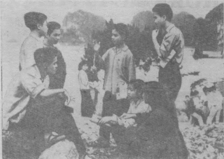
Демократическая Республика Вьетнам. Школьники на берегу залива Алон.