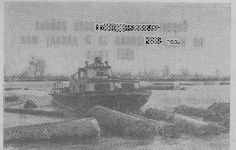
На реках Приморского края начался сплав леса. На молевом сплаве по магистральной реке Уссури применяется дистанционно-патрульный метод. На снимке: рабочие мастерского пункта «Красная сопка» Верхне-Уссурийского сплавоочного участка снимают обсохшую древесину с косы при помощи нового мощного катера.

В заключение академик Н. М. Сисакян говорил о неисчерпаемых возможностях будущего использования энергетических ресурсов Вселенной.