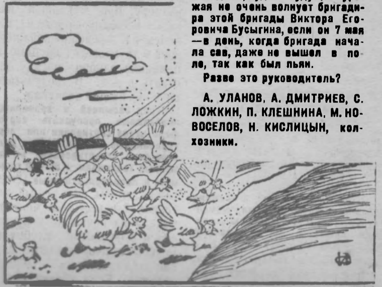
—Вот куда ходить-то надо! Сыты будем! Рис. И. Сычева.

На на высоте проходит сев в первой комплексной бригаде колхоза «Память Ленина». Семена заделываются плохо, примерно одна треть их остается на поверхности.