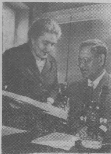
ЛЕНИНГРАД. Во Всесоюзном научно-исследовательском институте защиты растений состоялся международный симпозиум по борьбе с сельскохозяйственными вредителями и зерновых культур. В нем принимали участие специалисты сельского хозяйства Пакистана, Афганистана, Ирана, Турции, Сирийского района ОАР.

Пастбищный период — пора большого молока. Пусть же он будет с первых дней таким в каждом колхозе.