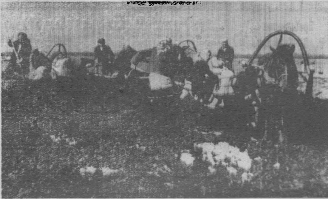
В ошарской бригаде колхоза имени Кирова под кукурузу вывезено по 30 тонн органических удобрений на каждый гектар. Вывозка продолжается.