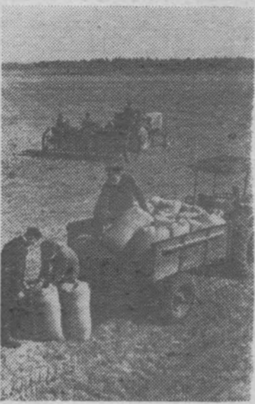
Калининская область. Около 200 тысяч гектаров засеют в этом году льном-долгунцом калининские льноводы. Одними из первых приступили к севу труженики сельхозартели «Свободный труд» Спировского района.