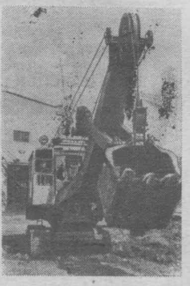
Работники Воронежского экскаваторного завода выполняют заказ героической Кубы: изготавливают землеройные машины.