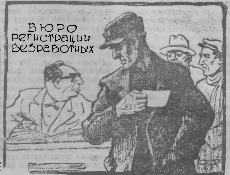
— Ну, этому-то чиновнику безработица не угрожает!

В США количество безработных превышает 5,5 миллиона человек.