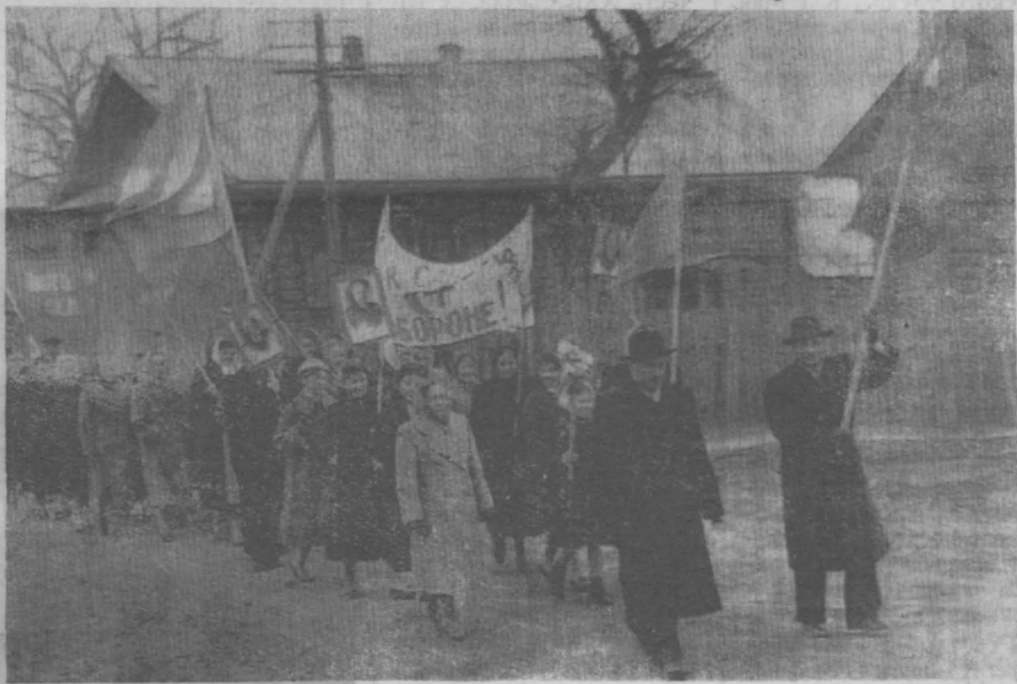
Первомайская демонстрация в селе Тоншаеве. На снимке: колонна медработников.