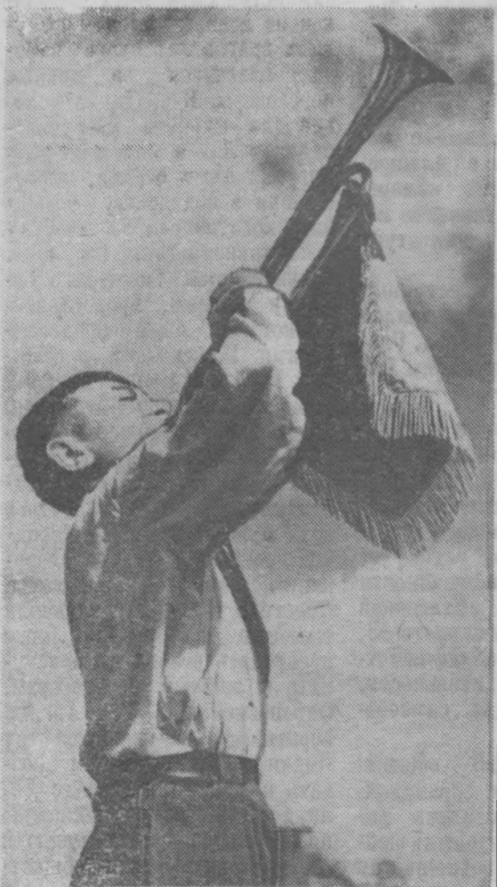
Боевой призыв