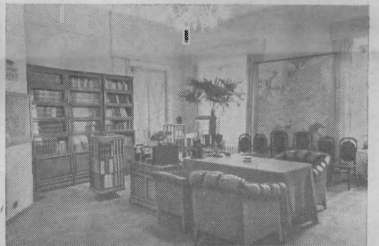
Москва. Кремль. Рабочий кабинет В. И. Ленина.