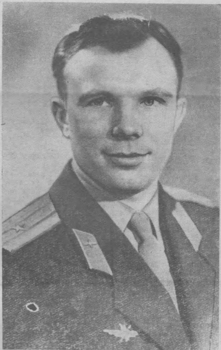
ГАГАРИН ЮРИЙ АЛЕКСЕЕВИЧ—первый в мире пилот-космонавт, совершивший 12 апреля 1961 года полет на корабле-спутнике «Восток». Фото В. Жихаренко.

Кортеж автомобилей, сопровождаемый мотоциклистами, направляется к Москве, к Красной площади. На всем пути следования героя горячо приветствуют миллионы москвичей и многочисленные гости столицы. (ТАСС).