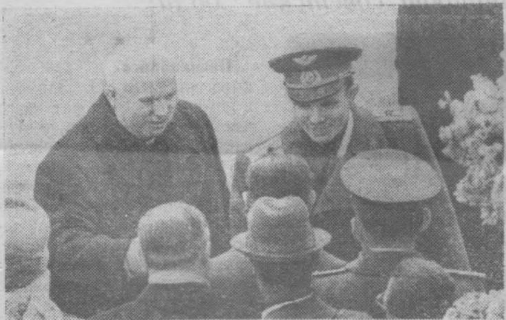
Москва. 14 апреля 1961 года. Торжественная встреча на Внуковском аэродроме славного сына советского народа героя-космонавта Юрия Алексеевича Гагарина.