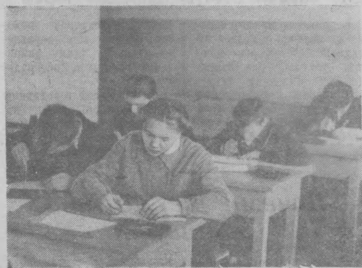
У десятиклассников—урок черчения.

Для разъяснения и конкретизации этой задачи в поездку по стране отправляется неумоимый борец за коммунизм Никита Сергеевич Хрущев. Вместе с передовиками сельского хозяйства, лучшими мастерами и организаторами социалистического земледелия и животноводства он вскрывает на зональных совещаниях новые и новые резервы увеличения производства зерна, мяса, молока и другой продукции. На штурм новых