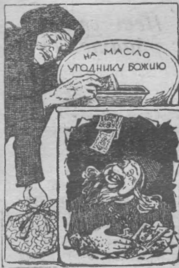
— Как живете, батюшка? — Вашими молитвами.