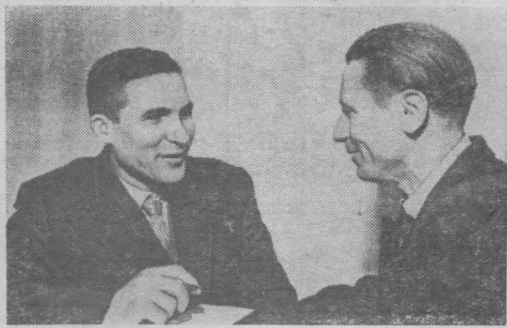
БЕЛОРУССКАЯ ССР. В прошлом году механизаторы колхоза «Октябрь» Хойникского района Гомельской области выращивали кукурузу на площади 170 гектаров. Себестоимость центнера силоса составила 8,5 копейки (в новых деньгах).