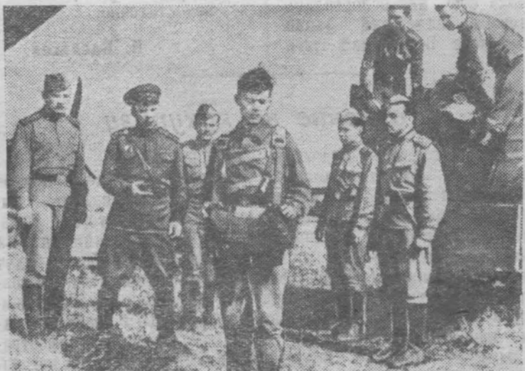
Кадр из новой кинокартины «Прыжок на заре» производства киностудии имени М. Горького. Фильм поставлен режиссером Н. Лукинским по сценарию Г. Березко.