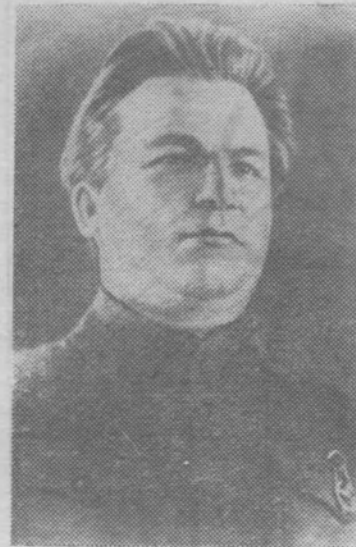
Сергей Миронович Киров.

Средняя школа № 2 имени С. М. Кирова — это быв-