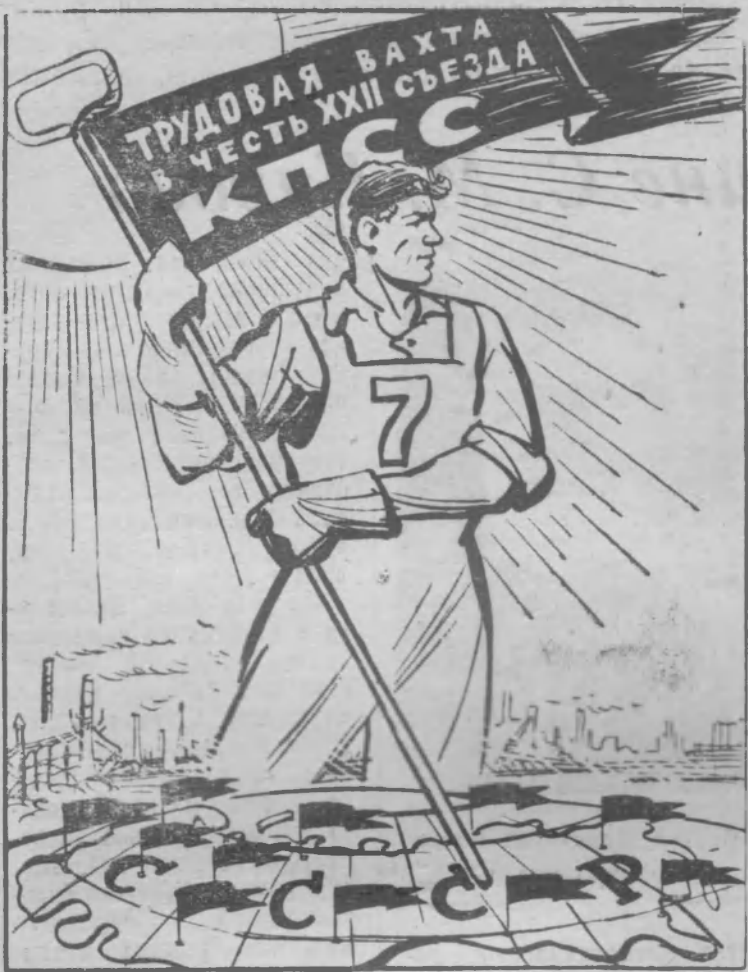
На вахте мира! Рис. В. Жаринова. Фотохроника ТАСС.