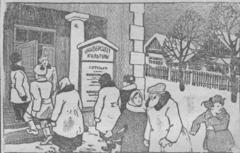
Студенты народного университета.

Разбирая своеобразие творческого облика того или иного композитора, юные «преподаватели» помогают сельскому слушателю формировать его собственные музыкальные и художественные вкусы. Должно быть, именно за это так ценят тоншаевский труженик занятия университета.