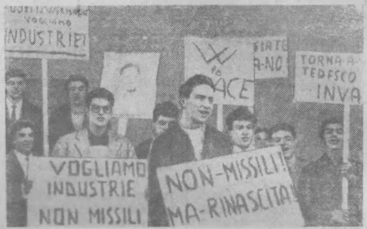
Молодежь острова Сардиния выражает решительный протест против политики, ведущей к усилению международной напряженности.

На снимке: группа демонстрантов с плакатами «Вермахт—вон!», «Хотим промышленность, а не ракет».