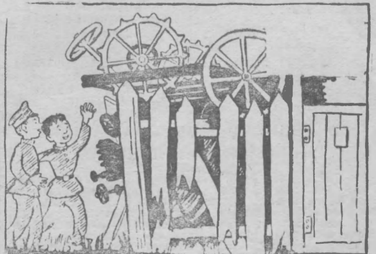
—Гляди, свалка,—вот где утиля-то соберем! —А разве он кому-нибудь нужен? Рис. В. Персона.