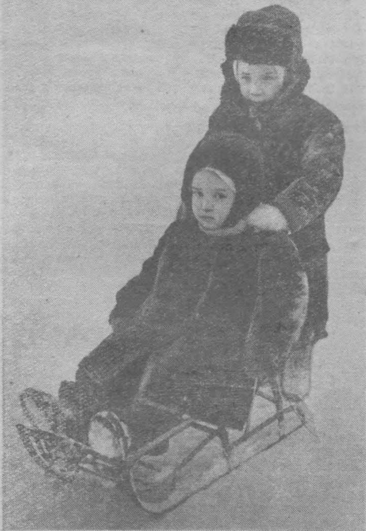
— Не бойся! Только держись крепче!