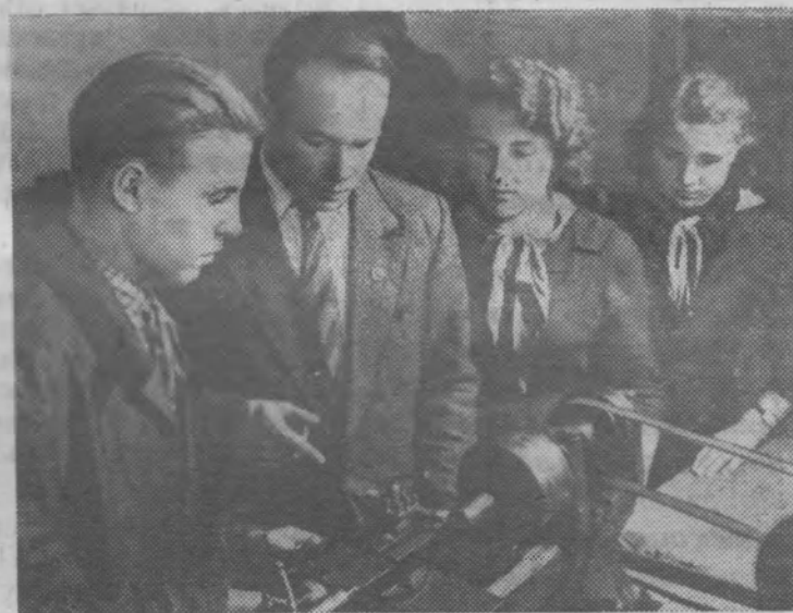
Днепропетровская область. Новое здание школы появилось в се-

ле Подгороднем, где расположена сельхозартель «Родина» Новомосковского района. Это — вторая школа, построенная колхозом за три года семилетки. Теперь все школьники учатся в одну смену.