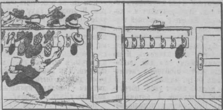
Первый день занятий