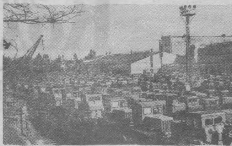
Сталинградские тракторостроители дали сельскому хозяйству 1 500 тракторов дополнительно к плану.

На снимке: отгрузка тракторов Сталинградского тракторного завода, изготовленных сверх задания Фото С. Курунина.