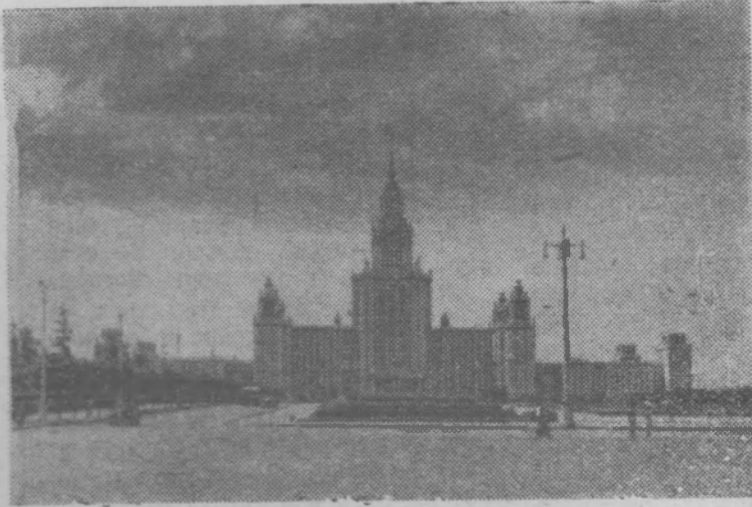
Здание Московского университета имени М. В. Ломоносова.