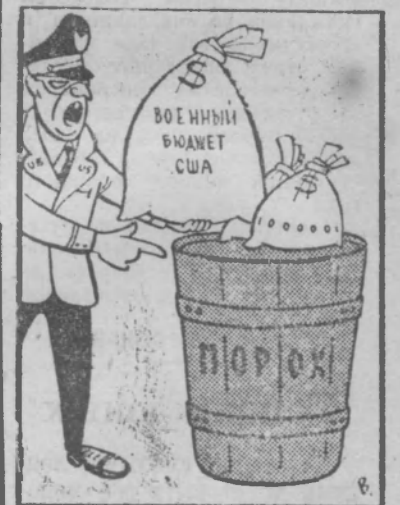
Деньги на бочку... Рис. М. Вайсборда.

* ТОКИО. 10.231 человек погиб в Японии во время несчастных случаев на городском транспорте за 11 месяцев этого года. Это рекордный показатель за все довоенные и послевоенные годы.