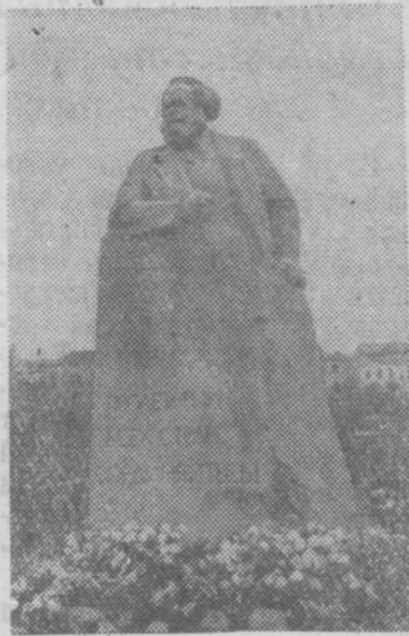
Москва. Памятник Карлу Марксу.