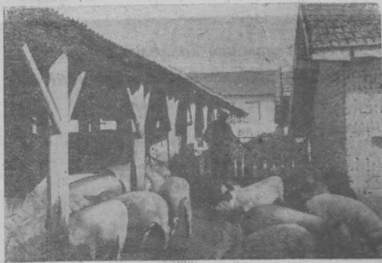
Механизированный свиноводческий комплекс для откорма 1800 голов скота в селе Генерал-Тошево.

Дело подлежит рассмотрению в городском народном суде г. Вологда.