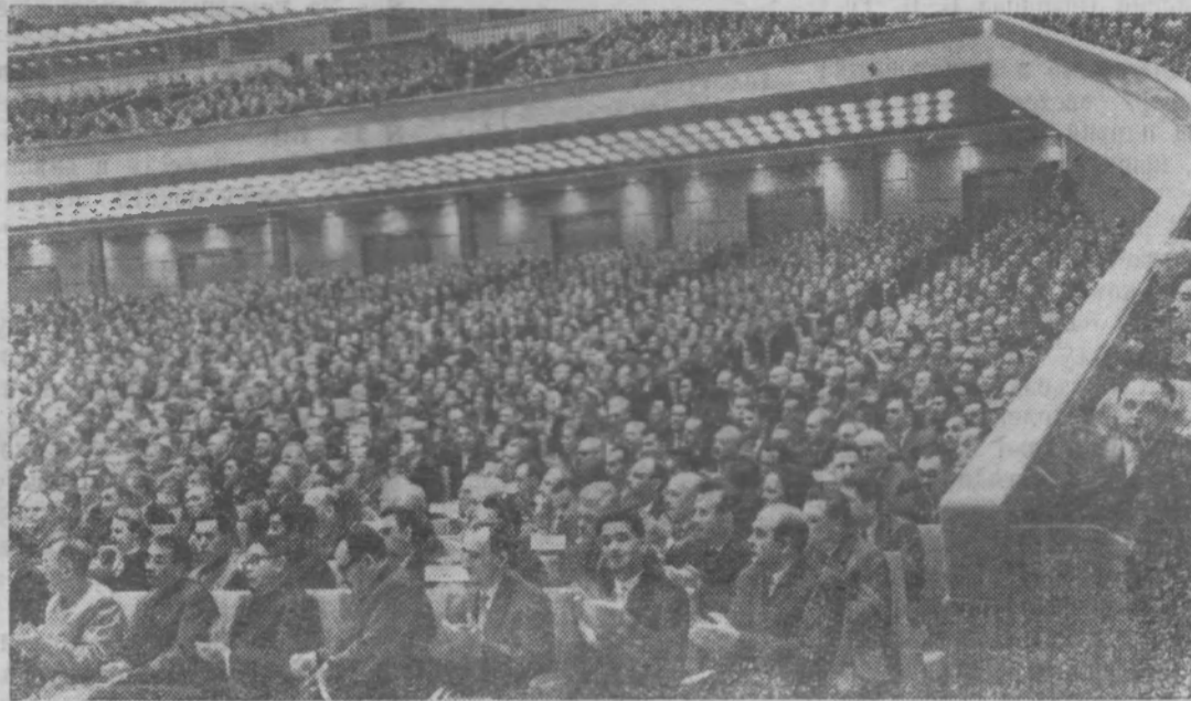
МОСКВА. XXII СЪЕЗД КОММУНИСТИЧЕСКОЙ ПАРТИИ СОВЕТСКОГО СОЮЗА. На снимке: в зале заседаний.

Твердо держит свое слово, данное партии, украинский народ. Задания семилетнего плана выполняются по республике с опережением на один год, а по отдельным отраслям народного хозяйства — на два года. Более чем удвоили выпуск продукции машиностроительная и металлообра-