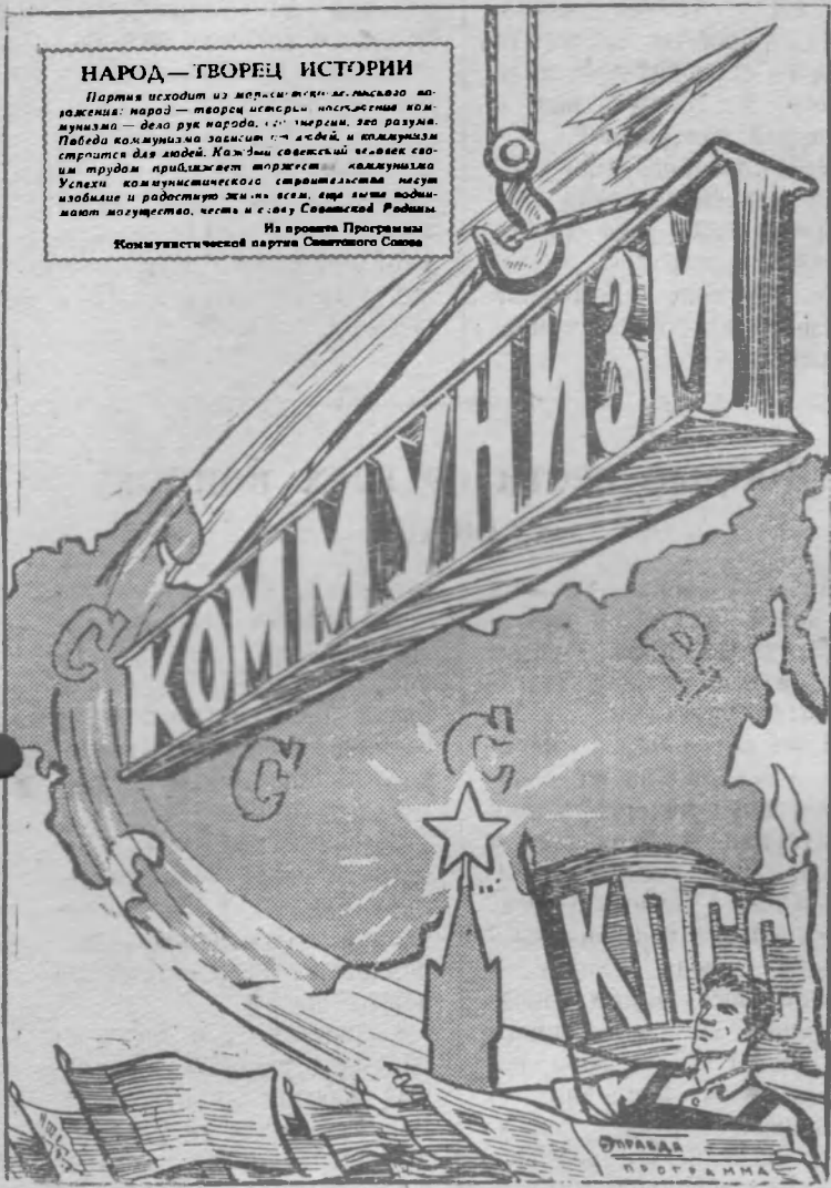
Рисунок В. Жаринова.