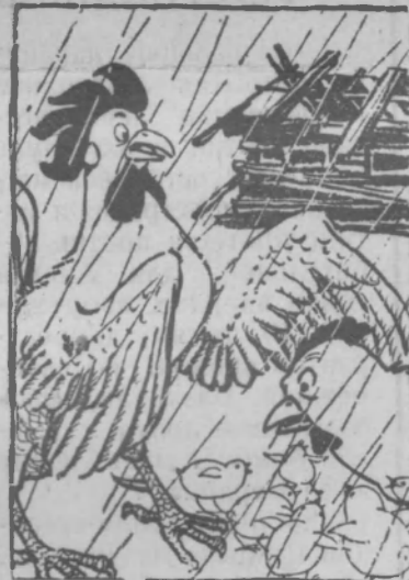
У красавца Петя Народились дети. Но куда ж их деть?!. Рис. К. ЕЛИСЕЕВА.