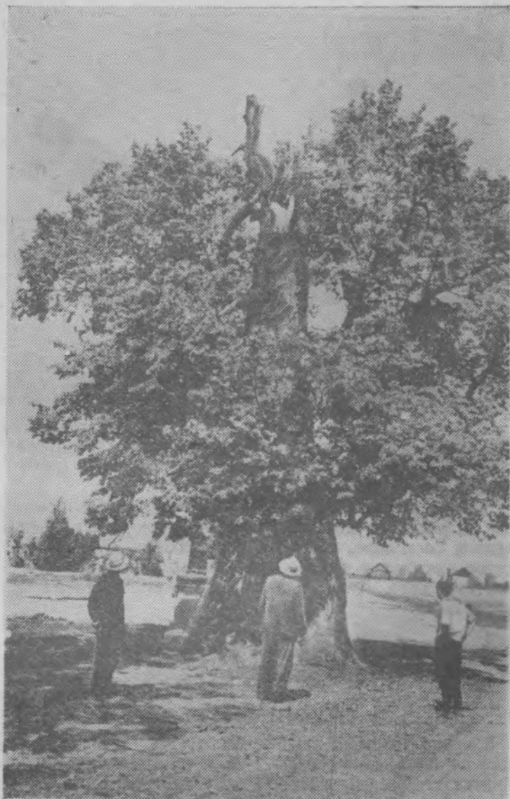
Недалеко от деревни Куверба растет вековая липа. В ней дупло, по которому на самый верх свободно взбирается человек.