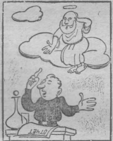
Не валите на бога! Рис. Ю. Федорова.

Слов нет, погода нынче хлебоборба не балует. Но это не значит, что в таких условиях надо сидеть сложа руки. Ждать, когда в поле просохнет, значит понапрасну терять дорогое время, упускать сроки уборки, допустить гибель урожая.