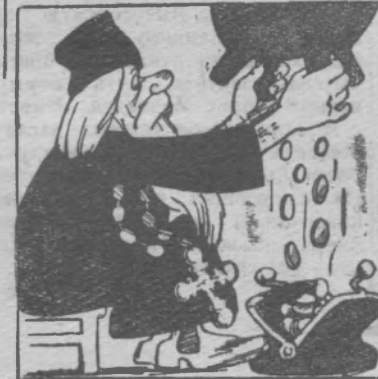
Божья коровка. Рис. А. Грунина.

галтером сельпо». Но ведь он подрастет и узнает правду... Да и самому стало как-то неудобно даже называться попом.