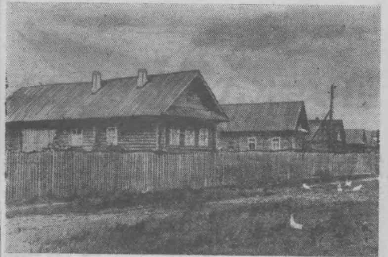
Поселок Буреполом. Дома учителей на улице имени Крупской.

На снимке: водохранилище «Батак».