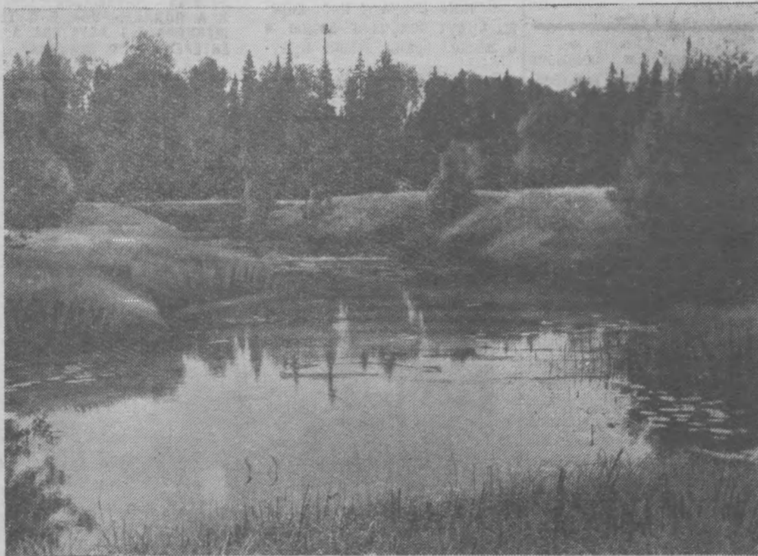
Вечер на реке Пижме.