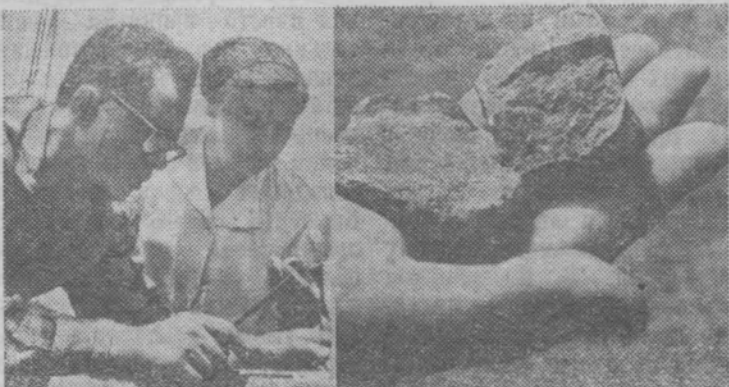
В Курганской области геологи закончили бурение еще одной, пятой по счету, разведочной скважины, подтверждающей нали- чие здесь железной руды.

На снимках: слева — геологи просматривают описания керн. Справа — железная руда Зауралья.