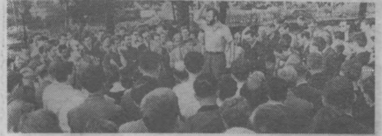
Лондон. В стране растет число сторонников ядерного разоружения.

На снимке: один из многих митингов в Гайд-парке против атомного и водородного оружия.