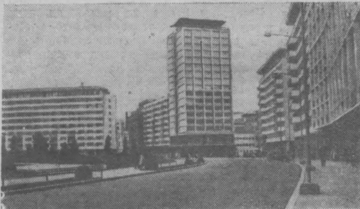
Столица Румынской Народной Республики Бухарест. Квартал новых жилых домов.