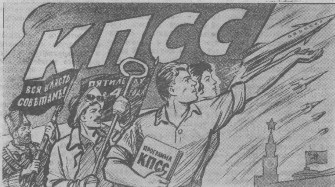
Рисунок В. Жаринова.

Варенцов В. В. Дупляков М. А. Жукова А. Н. Зайцев П. В. Зайцев Г. В. Краев М. А. Крашенинников В. А. Михалицын М. Н. Орлова Г. И. Путиков Е. К. Рубцов А. С. Смирнов В. А. Табункина Р. П. Червоткин В. Н. Чикишев М. В.