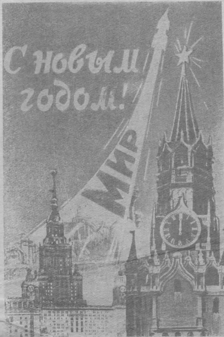
Фотоплакат Б. Антонова.