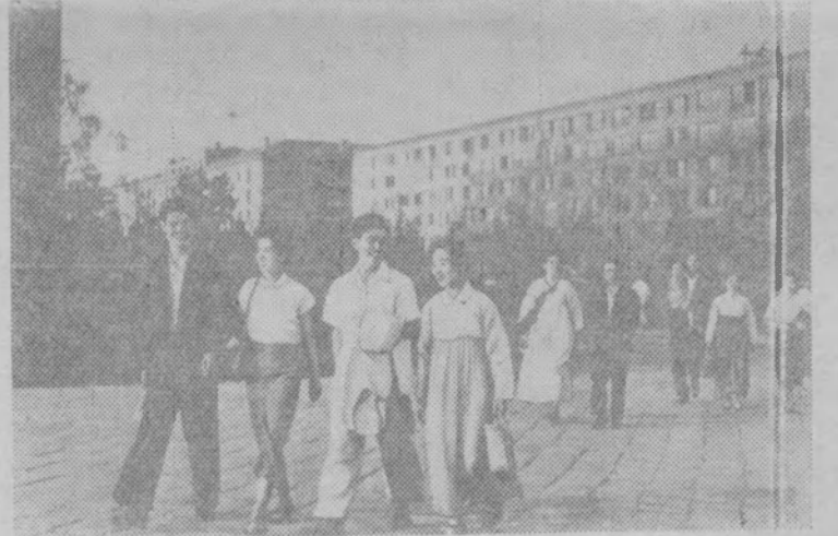
Корейская Народно-Демократическая Республика. Пхеньян.

15 августа—15 лет со дня освобождения Кореи от японских захватчиков