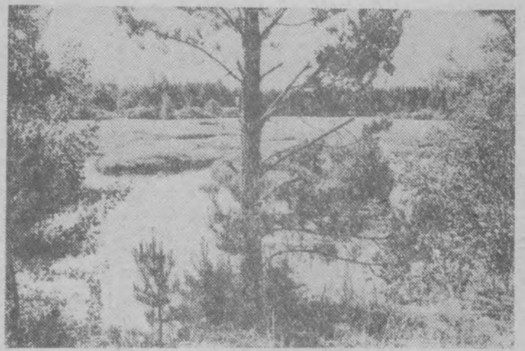
На реке Ошме.