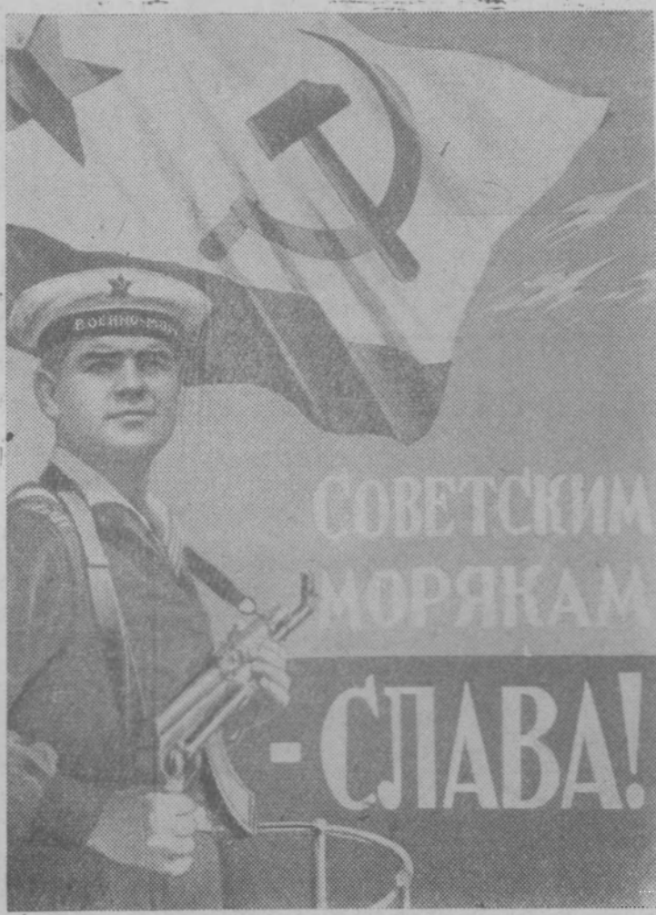
Плакат Б. Антонова.