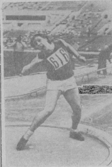
Москва. Соревнование на личное первенство СССР по легкой атлетике.

В толкании ядра первое место заняла ленинградская спортсменка Тамара Пресс, установившая новый мировой рекорд с результатом—17 метров 42 сантиметра.