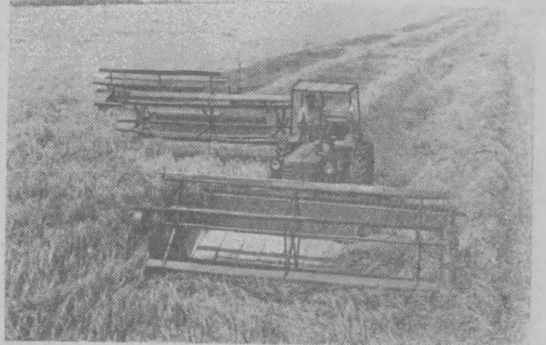
КРАСНОДАРСКИЙ КРАЙ. Образцы трудового героизма показывают на уборке хлебов механизаторы Кубани. В эти дни на полях Газырского зерносовхоза можно увидеть необычный уборочный агрегат, состоящий из трактора «Беларусь» с тремя жатками: одной навесной и двух прицепных. Управляет этим агрегатом один человек — тракторист.

На снимке: косовица ячменя строчными жатками в Газырском совхозе.